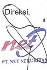
Wito Presiden Direktur